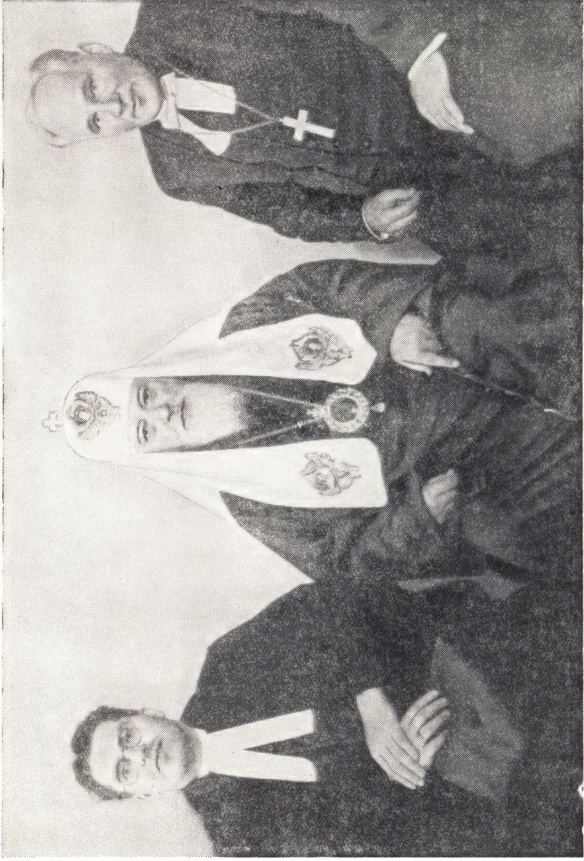
В ПАТРИАРШИХ ПОКОЯХ СВЯТЕЙШИИ ПАТРИАРХ АЛЕКСИЙ, АРХИЕПИСКОП ГУСТАВ ТУРС, ПАСТОР ГУГО ВАН ДАЛЕН